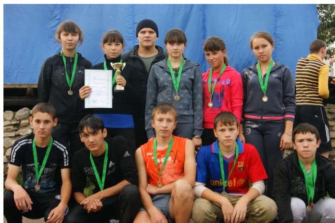
Участники осенней эстафеты