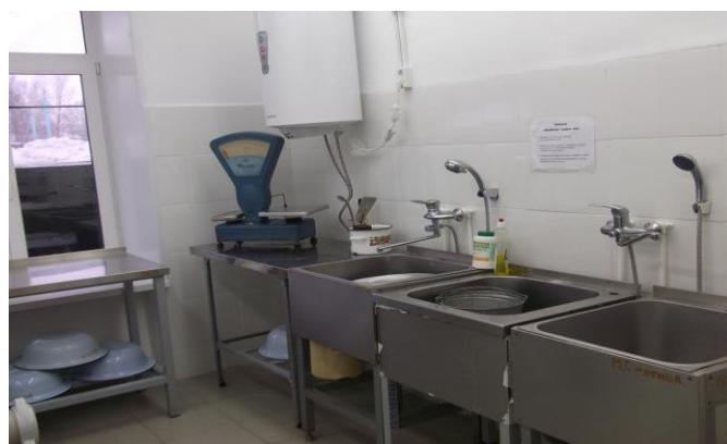
Овощной цех столовой