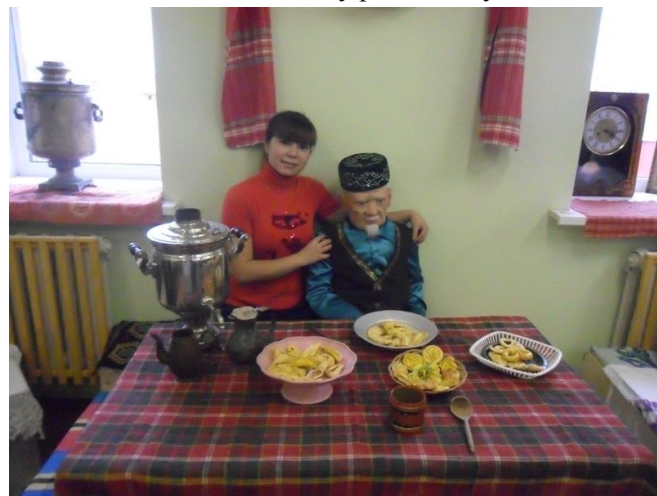
В краеведческом музее