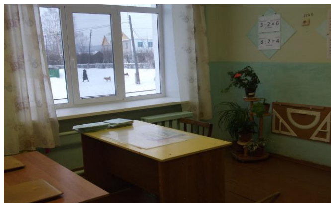
Кабинет 4 класса