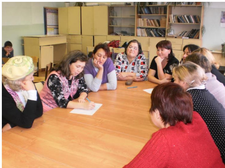
Мама пятиклассников в раздумьях...